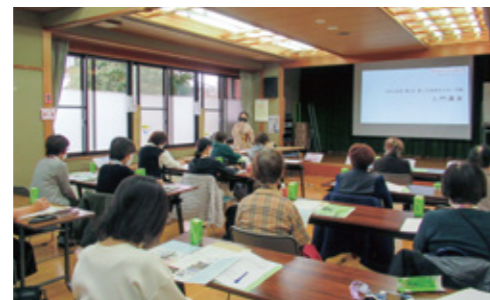
支え合い活動入門講座(担い手の養成)