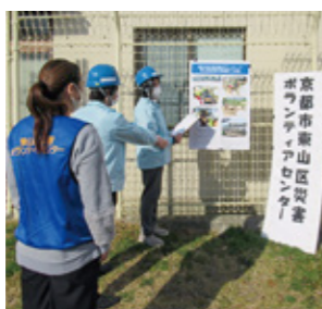
災害ボランティアセンター 設置運営訓練