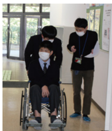
福祉教育(車いす体験)

区内ボランティアグループの交流や多様な担い手とのネットワークづくり、ボランティアの養成や活動の啓発を行っています。車いすの貸出やボランティア保険の加入受付も行っていきます。