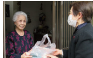
ふれあい配食・訪問安否確認