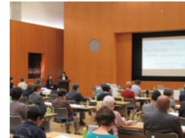
地域福祉シンポジウム

シンポジウム等で地域の活動を共有・発信し、地域課題の解決に向けて取り組んでいます。