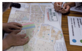
防災マップの作成