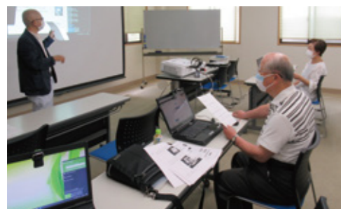
地域づくりに関する意見交換