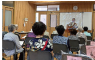
健康すこやか学級

東山区内には11の元学区があり、各学区社協では地域の实情に応じて、地域の各種団体と連携しながら「住民主体の地域福祉活動」を推進しています。地域にお住いの高齢者や障害のある方、子育て中の方々を対象に、ふれあい・学び合う・支え合う活動の充実を目指しています。