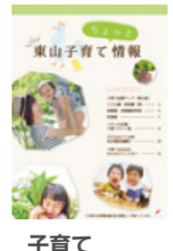
子育て ちょっと情報誌

その他に「こころのふれあいネットワーク」「障害者地域自立支援協議会」「子育て支援調整会議」「スマイルミュージックフェスティバル」「地域ケア会議」等に参画し関係機関と連携を図っています。