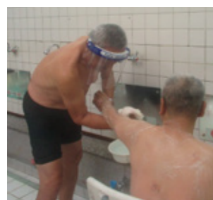
障害児者デイ銭湯

災害時のボランティアの調整や資機材の調達を行います。 また、災害時に配慮が必要な方の対応方法について防災訓練等で普及啓発しています。