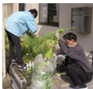
ボランティア支援