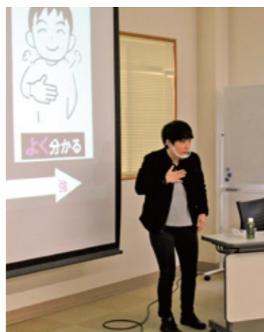
聞こえに関する講座 (京都聴覚言語障害者福祉協会)